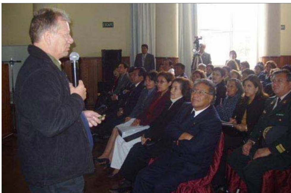
Participando por invitación a Congresos Internacionales sobre Suicidio

Se asiste entonces al surgimiento de una nueva familia que he dado en llamar la familia Wi-Fi pues es en estas zonas donde se pueden encontrar los de afuera con los de adentro. Y los asuntos familiares se esparcen y se diluyen entre todos los individuos que hacen uso de estos servicios, aunque no sean “ni parientes siquiera”.