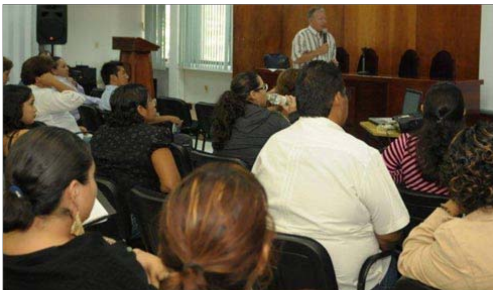
Participando por invitación a Congresos Internacionales sobre Suicidio

La ruptura familiar por el exilio, las colaboraciones en naciones extranjeras, las movilizaciones dentro del territorio nacional y otras razones, requieren la elaboración de un duelo, lo cual no siempre se consigue, generando estados depresivos diversos. Estos estados, si no se toman medidas terapéuticas a tiempo, pueden evolucionar a la cronicidad.