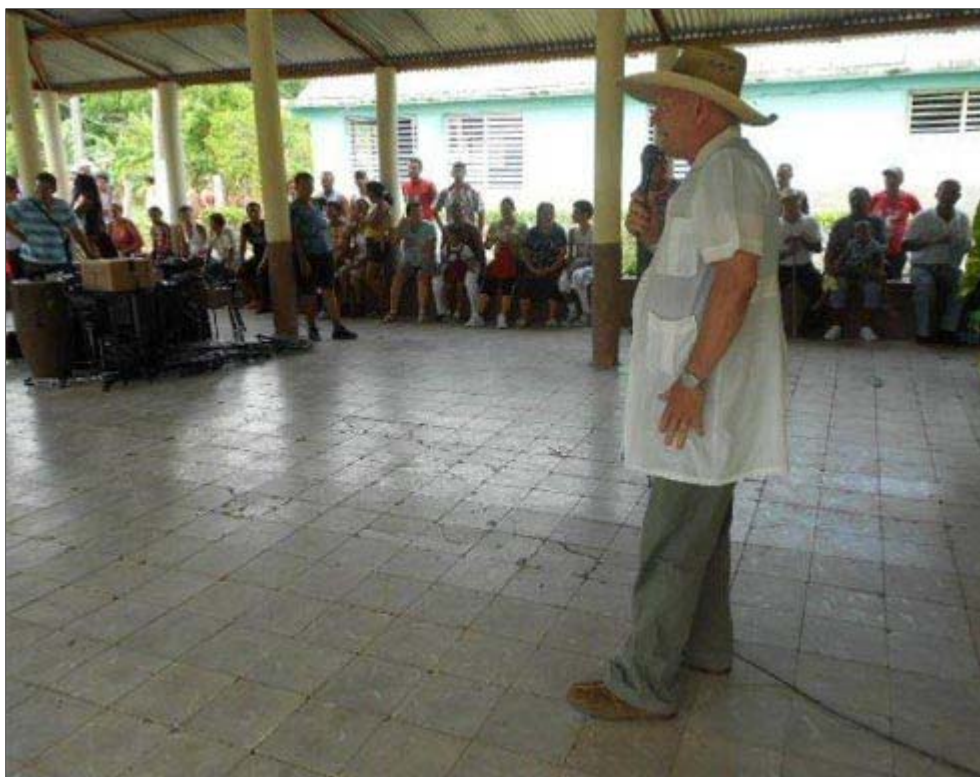
Recorriendo los campos de Cuba para la prevencion del suicidio

No creo que influya la visita de Obama, pues a las autoridades de Salud les importa un bledo para cuestiones domésticas. A ellos les interesa la visita de Obama en cuanto a los negocios que puedan hacer y siempre como intermediarios de esos negocios. Si alguno de mis colegas estadounidenses quisiera hacer un Centro de Prevención del suicidio poniendo el capital y que yo fuera su director, en el que se hicieran capacitaciones e ingresos de ciudadanos extranjeros pagando sus servicios y a ciudadanos cubanos sin costo alguno, no lo permitirían, pues el intermediario tiene que ser el Ministerio de Salud, con quien se tendría que hacer dicho negocio, no conmigo. Y es muy posible que ellos propongan hasta el director, aunque los inversionistas deseen que sea yo quien asuma dicha responsabilidad.