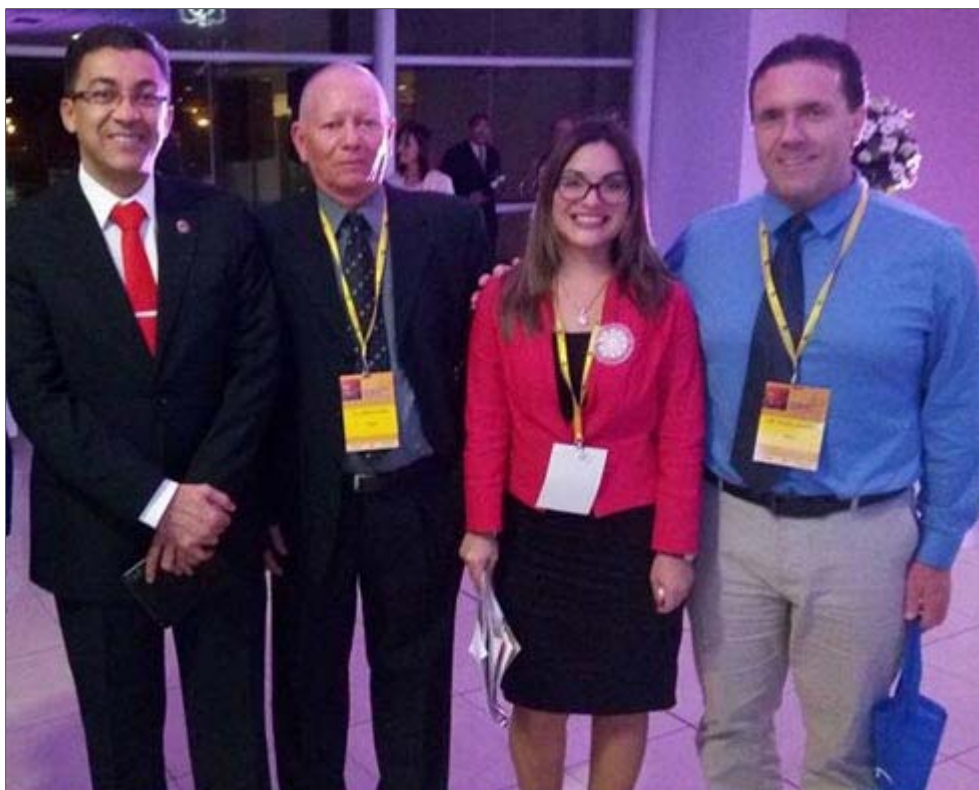
Participando por invitación a Congresos Internacionales sobre Suicidio

Años después se me privó de asistir a un congreso en Uruguay, con todos los gastos cubiertos que es la única manera que puedo salir de Cuba, y me dijeron que no debía asistir pues "no era prudente" que lo hiciera. Pero nunca nadie me dijo quien fue quien considero tal cosa ni quien tomo tal decisión.