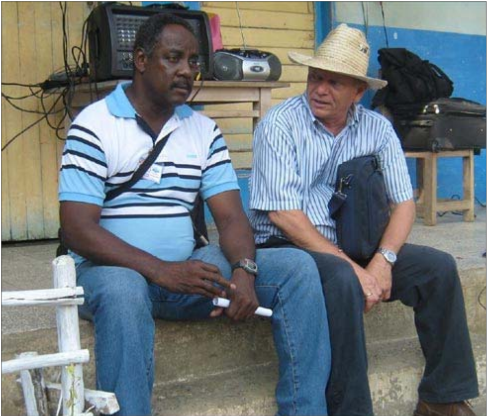
Recorriendo los campos de Cuba para la prevención del suicidio

No he estado en esa situación pues el único país donde trabajo es Cuba, atendiendo a mis compatriotas. Pero no voy a ningún país a trabajar enviado por el Ministerio de Salud puesto que según me han informado mis colegas, el ministerio se queda con la mayor parte del dinero.