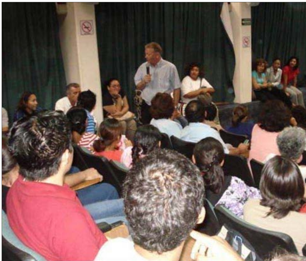
Participando por invitación a Congresos Internacionales sobre Suicidio

El NO HAY induce al conformismo, a la indolencia. Y a los profesionales que deseamos trabajar bien, el NO HAY nos lo impide.