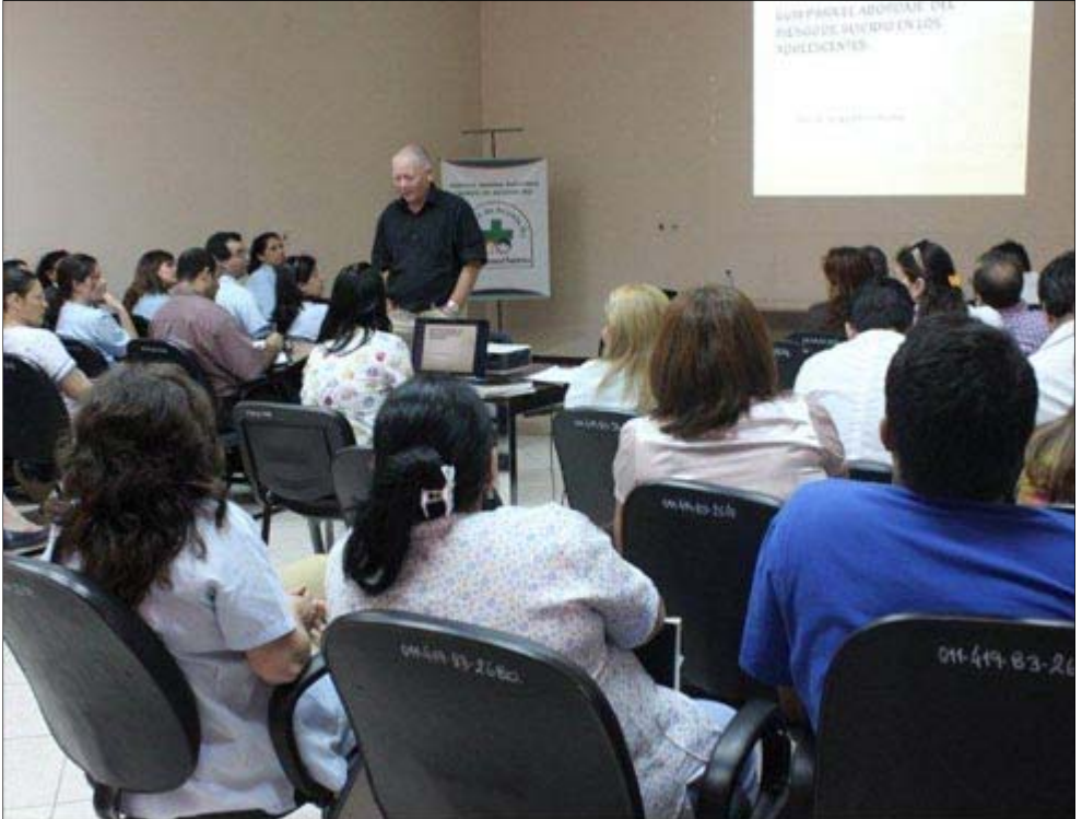
Participando por invitación a Congresos Internacionales sobre Suicidio