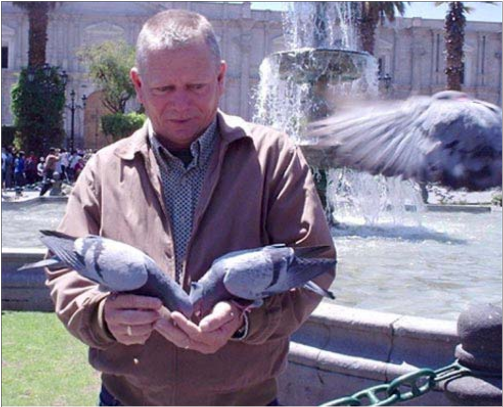
Considerado como la mayor autoridad académica sobre Suicidio en Cuba

Entrevista realizada por Organización Médica Colegial de España el 2 de Marzo de 2017