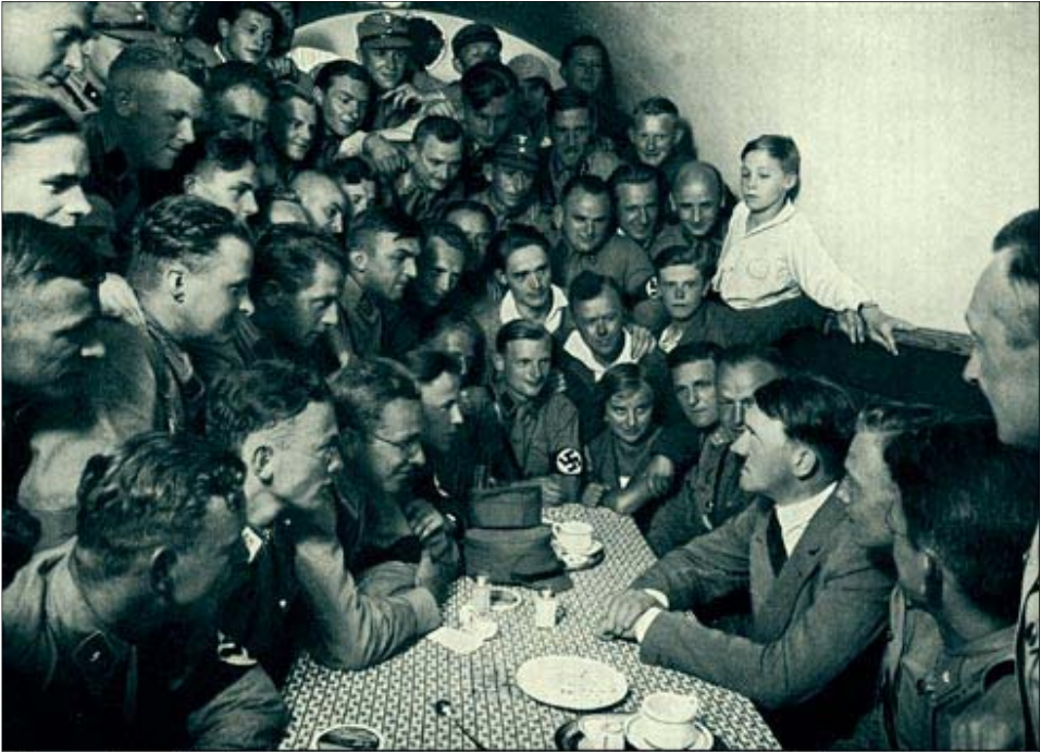
Encuentro del Comandante en el Congreso de la Juventud

predelictiva”, la cual, por increíble que parezca, permite a los fiscales del socialismo verde olivo, como en la película Minority Report, castigar el delito antes de que sea cometido.