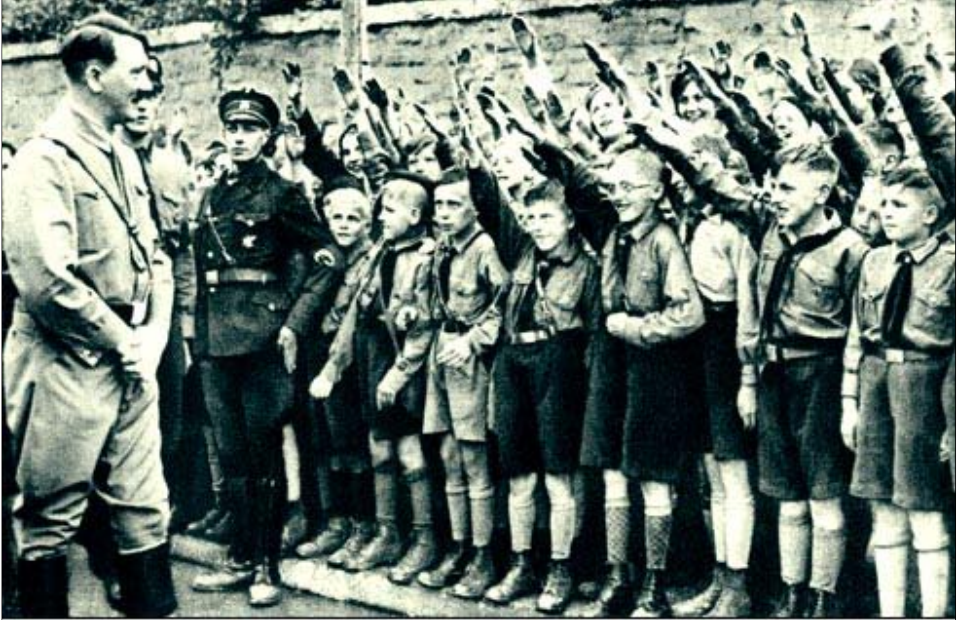
Seremos como el Che