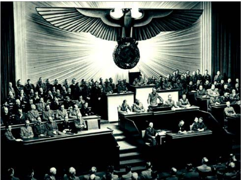
Los Hombres mueren, el Partido es Inmortal

Además de los calcos del comunismo soviético, el castrismo tomó préstamos del nazismo, como entre otros, los blockharts y la Juventud Hitleriana para conformar los Comités de Defensa de la Revolución (CDR) y la Unión de Jóvenes Comunistas (UJC), respectivamente.