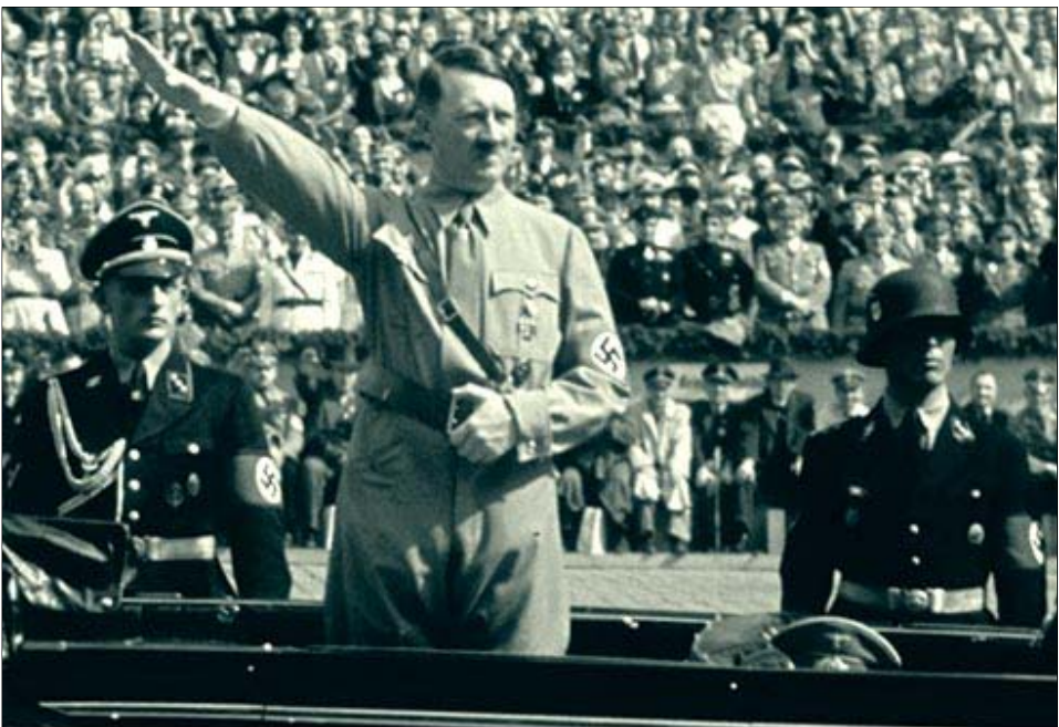
Todos gritarán será mejor hundirnos en el mar que antes traicionar la gloria que se ha vivido

En la Alemania nazi, a partir de 1937, basándose en el párrafo 42 del Código Penal del Tercer Reich para mantener la ley y el orden, fueron autorizados, sin tener la policía que recurrir a los tribunales, los arrestos preventivos no solo de delincuentes habituales sino también de personas que fueran consideradas potenciales delincuentes. Eran definidos como volksschädling (antisociales), una categorización que incluía, entre otros, a prostitutas, homosexuales, mendigos, sicópatas, repetidores de chistes y comentarios en contra de los nazis y vagos (considerados como tales los que se negaran a aceptar en dos ocasiones los empleos que les fueran ofrecidos por el Estado).