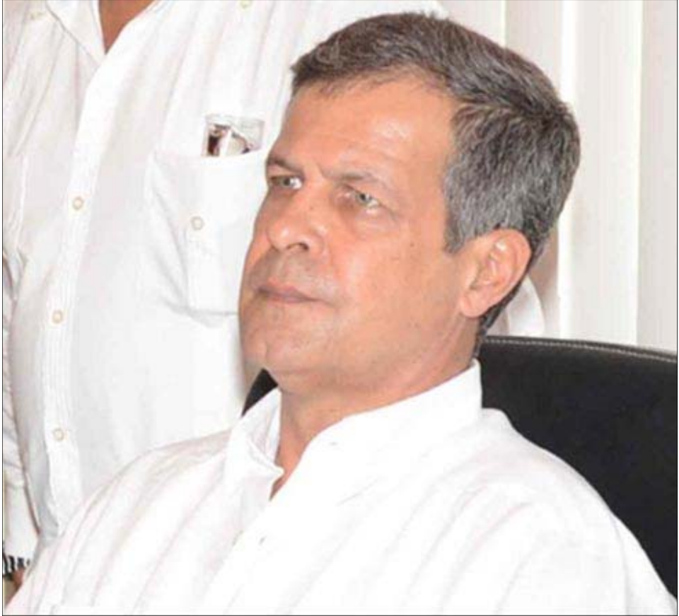
Luis Alberto Rodríguez López Callejas

La estructura de lo que hoy se conoce como GAESA y que en el vocabulario de los militares es tan solo “el GAE”, comenzó a formarse a principios de los 80 como parte del Departamento Económico del Ministerio de las Fuerzas Armadas, dirigido por el General de División Casas Regueiro.